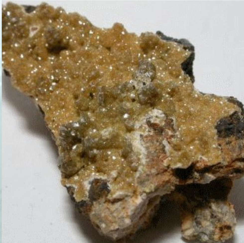
IMMAGINE ESEMPLIFICATIVA DI AGGREGAZIONE DI VANADITE